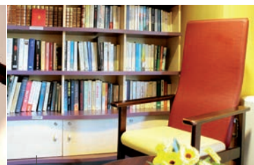
Salon de lecture